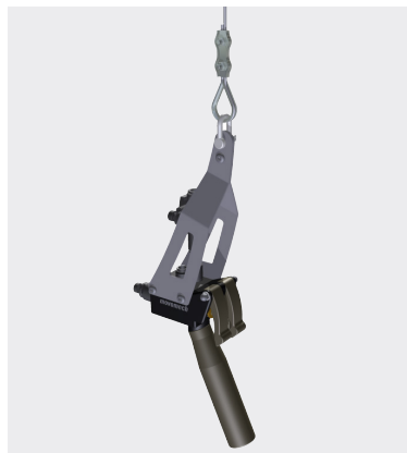
Mechline Pro snabbhandtag

** Luftmatning till verktyg (direktstyrd pneumatik)